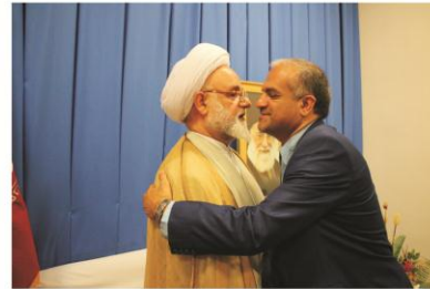
دیدار رئیس دانشگاه با امام جمعه ایلام در جریان سفر معاون وزیر بهداشت به ایلام