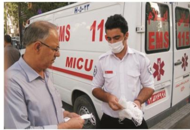
توزیع ماسک در بین مردم در جریان ورود ریزگردها به استان