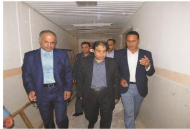
بازدید معاون برنامه ریزی و امور حقوقی وزارت بهداشت و رئیس دانشگاه از بیمارستان شهدای دهگلان